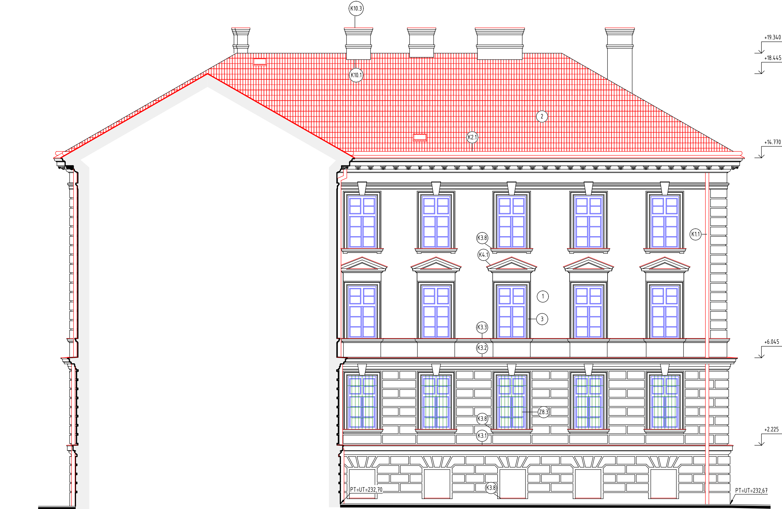
POHLED JIHOZÁPADNÍ - DVORNÍ